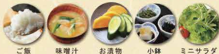
ご飯 味噌汁 お漬物 小鉢 ミニサラダ