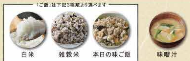
白米 雑穀米 本日の味ご飯 味噌汁