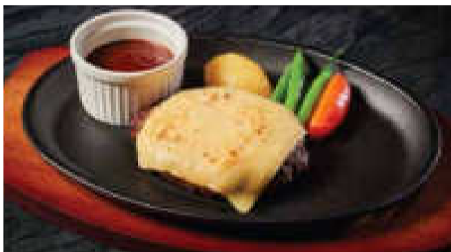
■とろとろチーズハンバーグ (150g)