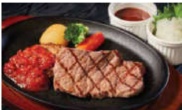
■イタリアンハンバーグ&ステーキ

Hamburg steak with cheese & US sirloin steak