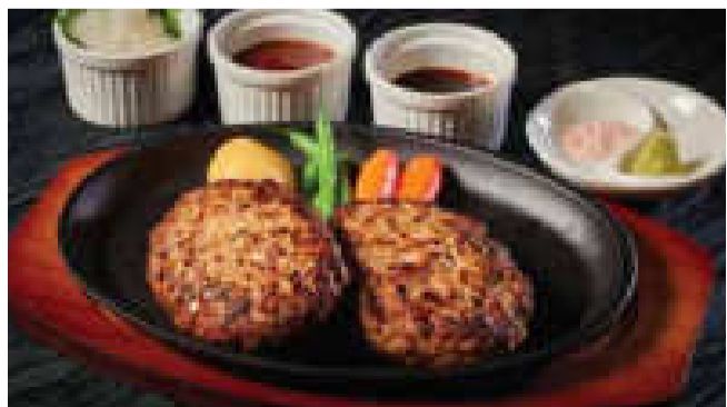
■常陸牛入りダブルハンバーグ (200g×2)