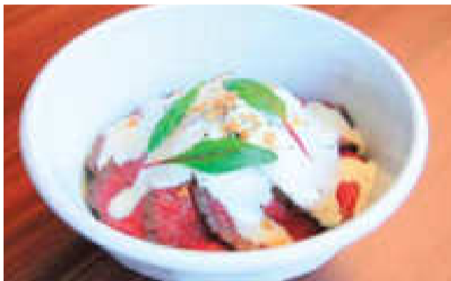
■常陸牛ローストビーフ丼