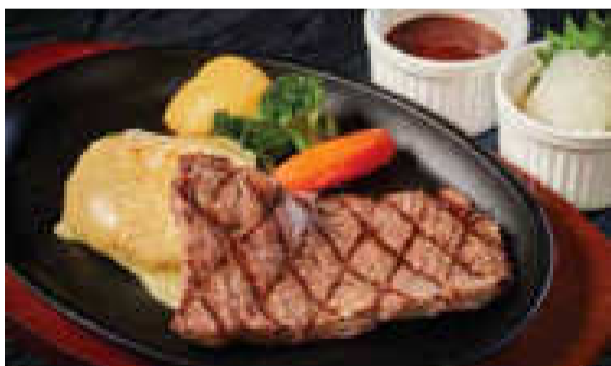
■とろとろチーズハンバーグ&ステーキ

ハンバーグ&エビフライ (ハンバーグ 100g&エビフライ 2本) ¥1,750