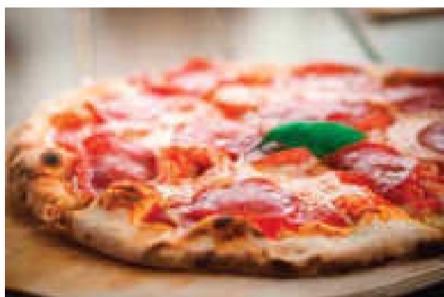
■マルゲリータピッツァ