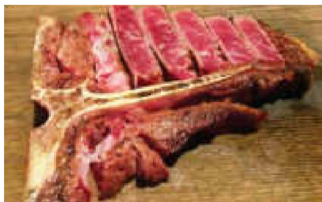
■T ボーンステーキ (400g)

茨城県が誇る銘柄牛『常陸牛』は指定生産者の磨かれた飼育管理技術と厳選された飼料により、30ヶ月にわたり育てられた黒毛和牛の中から、食肉取引規格A、Bの4と5等級に格付けされた最高級ブランドです。