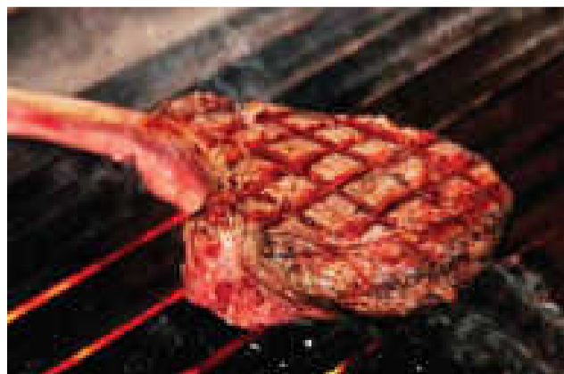
■トマホークステーキ (700-800g)