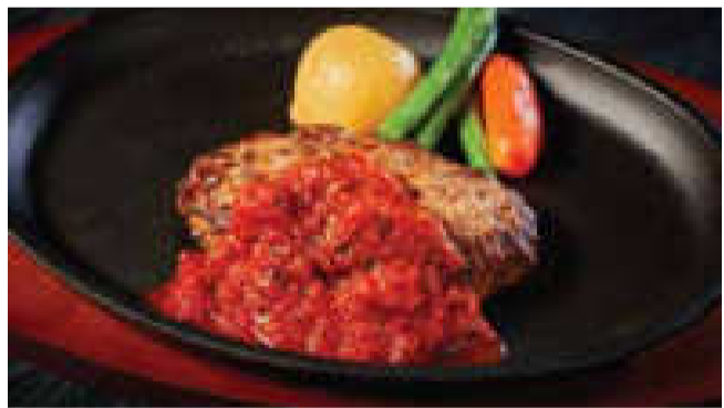
■イタリアンハンバーグ (150g)