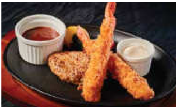
■ハンバーグ&エビフライ

ハンバーグ&ステーキ (ハンバーグ 100g&US サーロイン 80g) ¥1,850