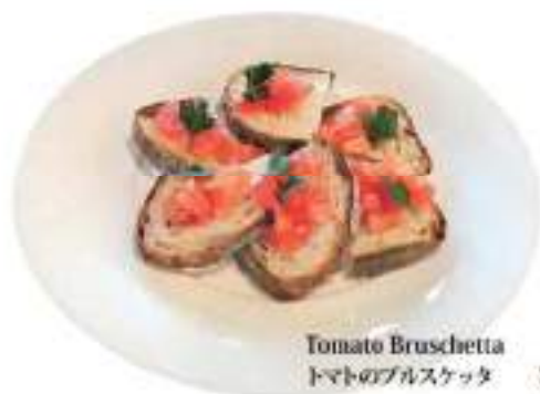
Tomato Bruschetta トマトのブルスケッタ ¥ 550 (税込)