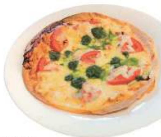
Margarita マルゲリータ・ピザ