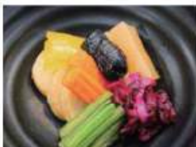
Picked vegetables 御しんこ盛り