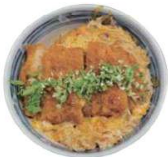
Deep-fried pork Rice bowl カツ丼