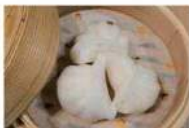
Steamed shrimp dumplings(3 pieces) 海老蒸し餃子 (3ヶ)