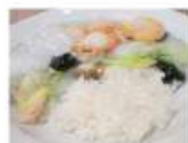
Seafood chop-suey rice bowl 海鮮あんかけ丼