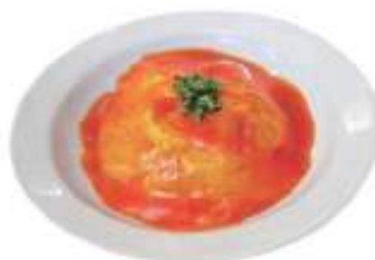
Crab meat omelet Chop-suey on top 天津丼