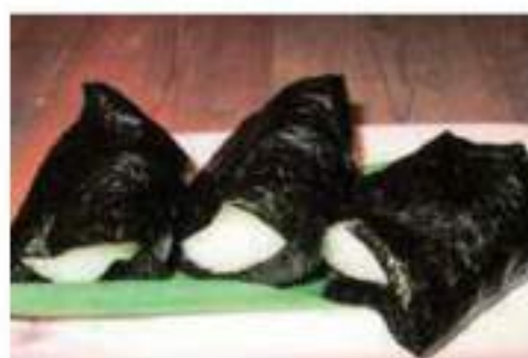
3 flavors of rice balls (plum salmon & dried bonito)