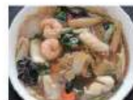
Shrimps and vegetable ramen Chop-suey on top 五目あんかけラーメン