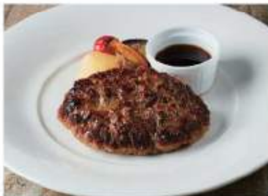
Hitachi beef hamburger 常陸牛ハンバーグ