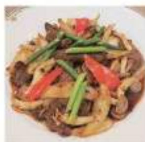
Stir-fried beef & vege with garlic sauce