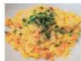
Spicy fried rice ピリ辛炒飯