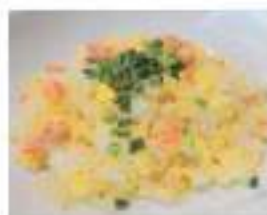
Crab fried rice カニ炒飯