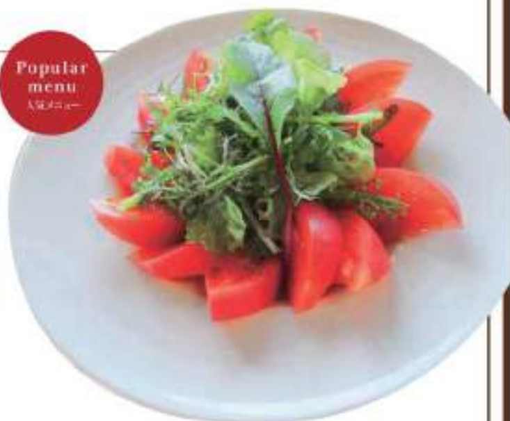
Caesar Salad シーザーサラダ ¥880 (税込)