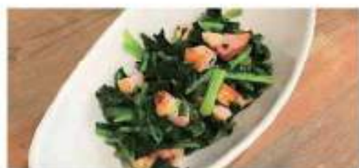
Stir fried spinach & bacon, Garlic flavor ほうれん草とベーコンのソテーガーリック風味