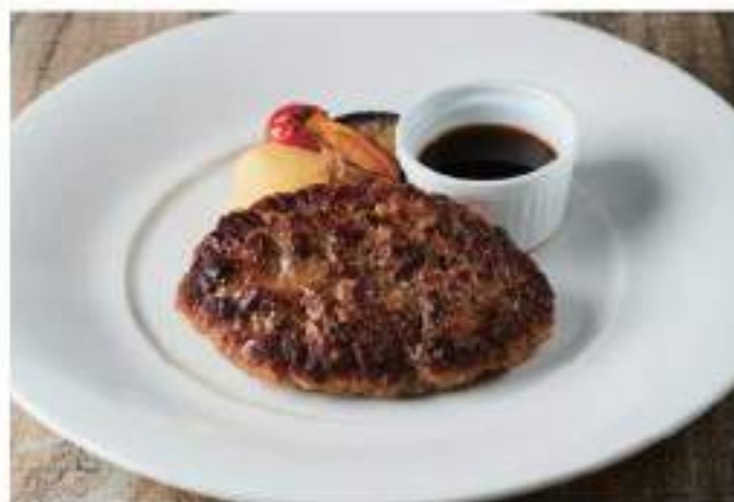
常陸牛ハンバーグ 和風ソース