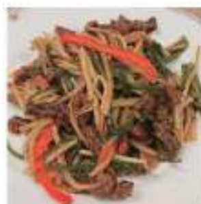
Stir-fried shredded Green pepper and beef