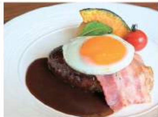
hamburger steak with demi-glace sauce