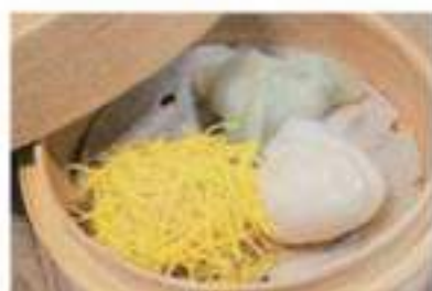
Dim sum (3 pieces) 点心三種 (3ヶ)