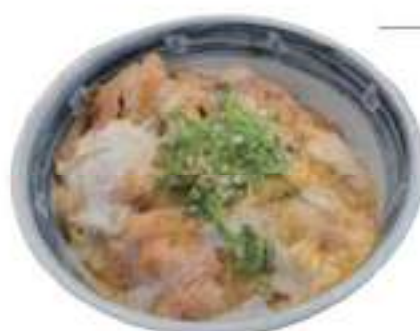
Chicken and egg Rice bowl 親子丼