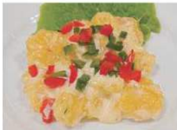
Shrimps with mayonnaise 海老のマヨネーズソース