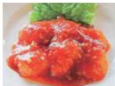
Stir-fried shrimp with sweet-sour chili sauce 海老のチリソース