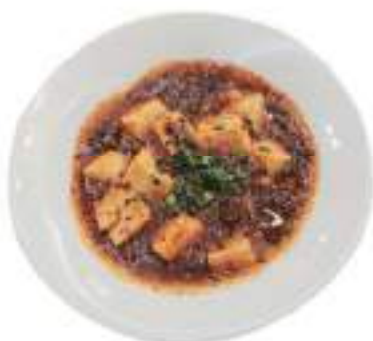
Mapo tofu 麻婆豆腐