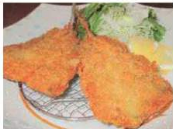
Deep-fried horse mackerel アジフライ