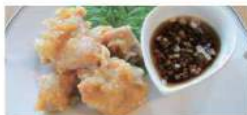
Chinese-style fried chicken