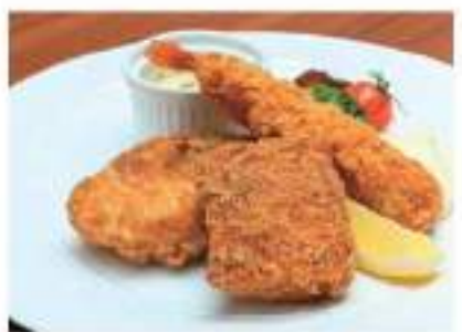
海の幸のミックスフライ (サーモン・帆立・イカ)