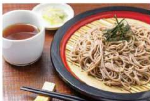
Local specialty soba 常陸秋そば