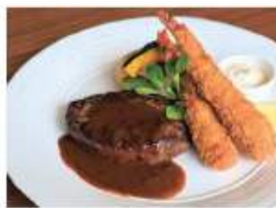
エビフライコンビ ハンバーグ

Fried Shrimp Combination hamburger steak