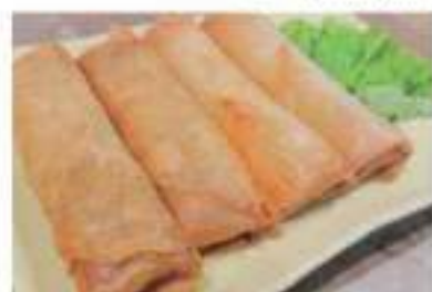
Egg rolls(4pieces) 春巻 (4本)