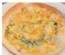
Gorgonzola cheese and Honey Pizza