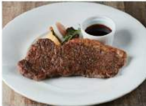
Sirloin steak (150g) US牛サーロインステーキ(150g)