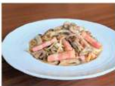
あさりとキノコの「カキ醤油」 を使った和風ペペロンチーノ