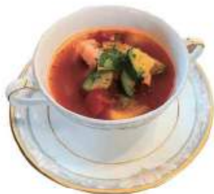
Minestrone (Italian-style tomato soup) 野菜とベーコンのミネストローネ ¥660 (税込)