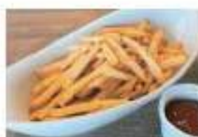
French Fries フライドポテト