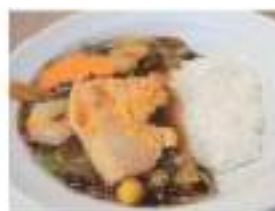
Shrimps & Vegetables Chop-suey rice bowl 五目あんかけ丼