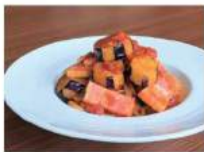
茄子と厚切りベーコンの 完熟トマトソースパスタ

pasta with eggplant and bacon in tomato sauce