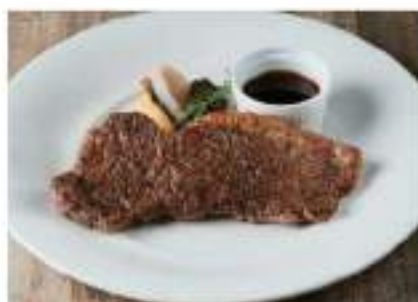
肉厚US牛 サーロインステーキ (150g)