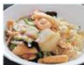
Shrimps & vegetables Chop-suey fried rice 五目あんかけ炒飯