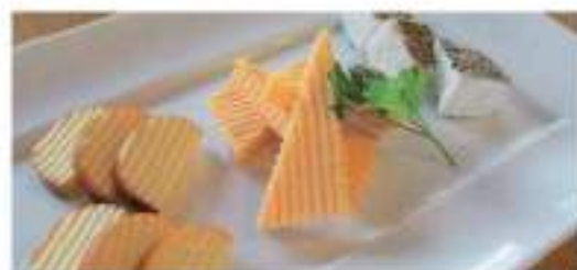
Assorted Cheese チーズの盛り合わせ ¥ 550 (税込)