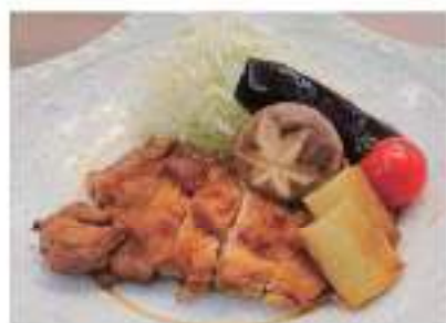
Teriyaki Chicken 鶏照り焼き