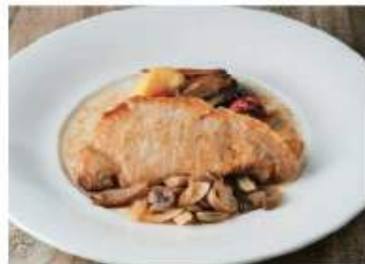
Ginger pork stir-fry ポーク生姜焼き