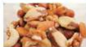
Mix Nuts ミックスナッツ