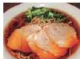
Slices of pork on top チャーシュー麺