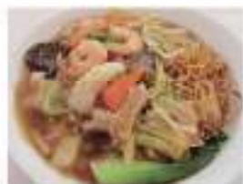
Shrimps & vegetables Chop-suey fried noodles 五目あんかけ焼きそば